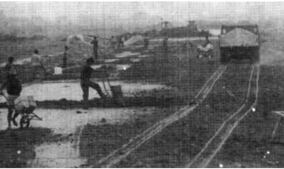
垦利黄河口经济技术开发区继续加强硬件设施配套建设，目前已投入资金8000余万元，建成工业企业14家，“三资”企业4家，精密铸造、石油化工等行业的企业体系已具规模。图为投资800万元、全长3144米的主干路——中兴路延伸工程一角。

两项新产品，销售势头看好。第四，下大气力抓清欠。过去，该厂有些发出去的贷款长期没有追回，个别人甚至发出价值几十万元的货却找不到买主。为此，厂里积极争取司法机关支持，以法清欠。去年8月以来，已收回货款100余万元。有效地启动了生产。 与此同时，该厂严肃整顿生产秩序、严明劳动纪律。厂里修订完善了各项规章制度，教育职工爱企业、爱岗位，团结一致、共度难关。 结束长期亏损的历史，对东塑人来说，实在是一件值得庆贺的事情。这起步虽然艰难，但希望