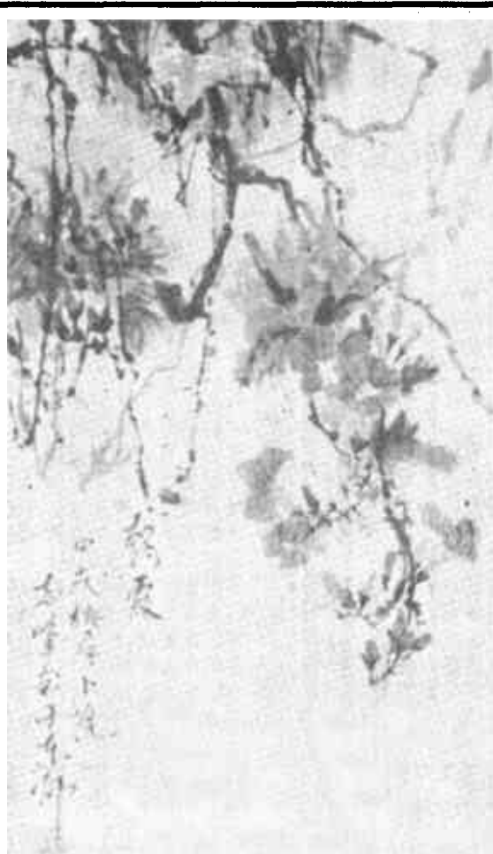
刊头画 志峰画 本版编辑：珏敏